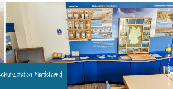
Ausstellungsräume Schutzstation Nordstrand